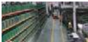
STOCK A SU DISPOSICIÓN