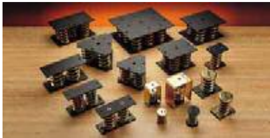
VIBRABSORBER: Suspensiones metálicas para bajas frecuencias.