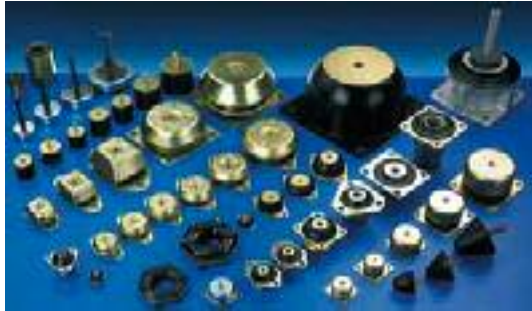
CAUCHO-METAL: Elementos de suspensión antivibratoria.