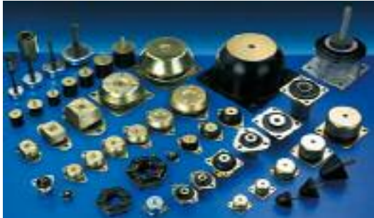
KAUTSCHUK-METALL: Produkte zur Schwingungsdämpfung.