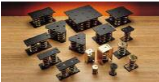
VIBRABSORBER: Metallbefestigungssysteme für niedrige Frequenzen.