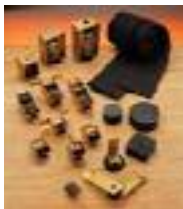
AKUSTIK: Schwingungskoppelndes Befestigungssystem für schalldichte Räume auf Kautschuk- und Federbasis.